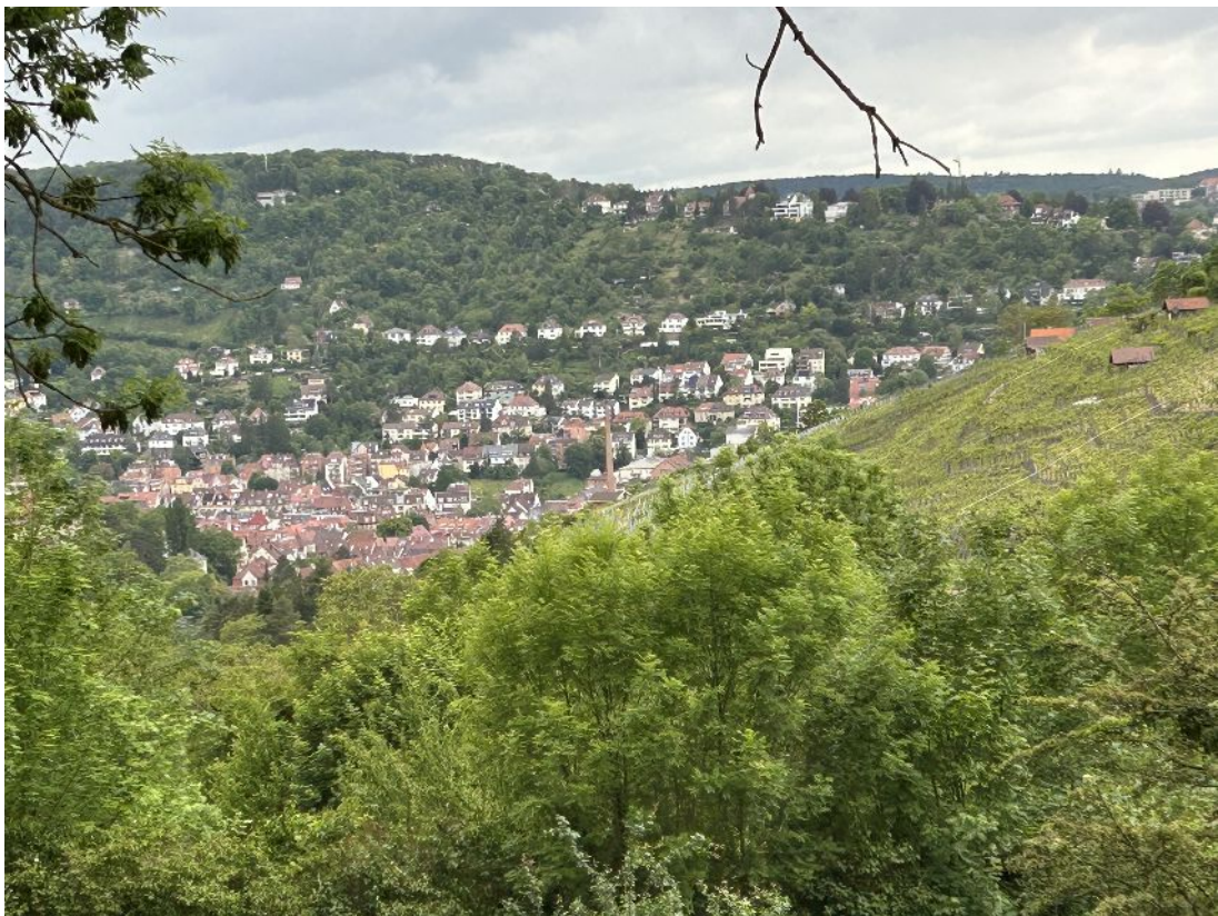
Foto: Aussicht auf Degerloch