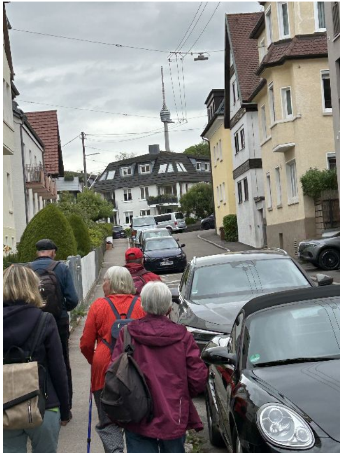
Foto: Degerloch mit Fernsehturm

Weiter wanderten wir die „Alte Weinsteige“ entlang und kamen an der Haltestelle Haigst vorbei. Jetzt erreichten wir einen hübschen Platz.